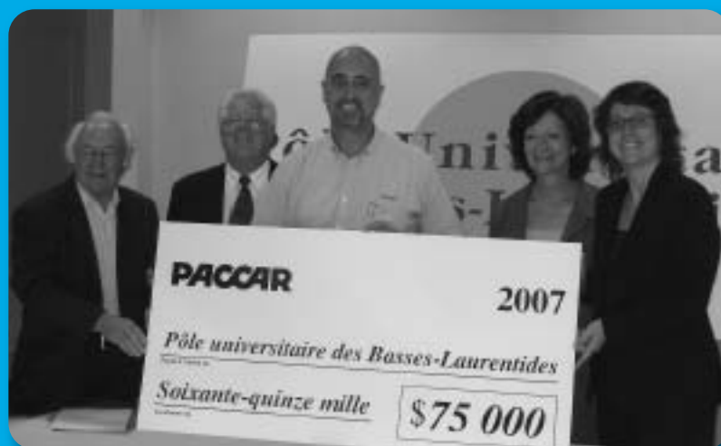
Appui financier de PACCAR du Canada Ltée