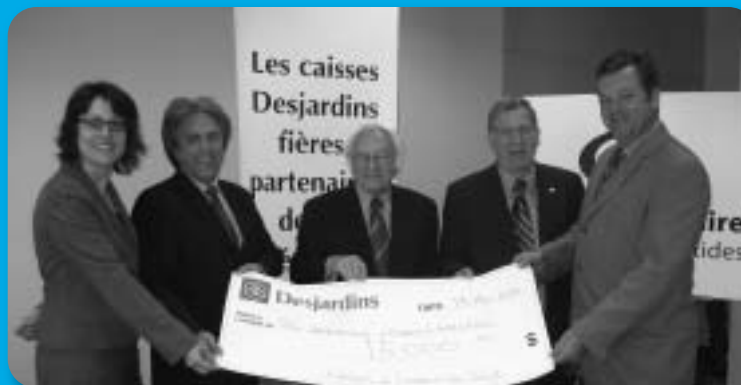
Appui financier des Caisses Desjardins Laurentides sud