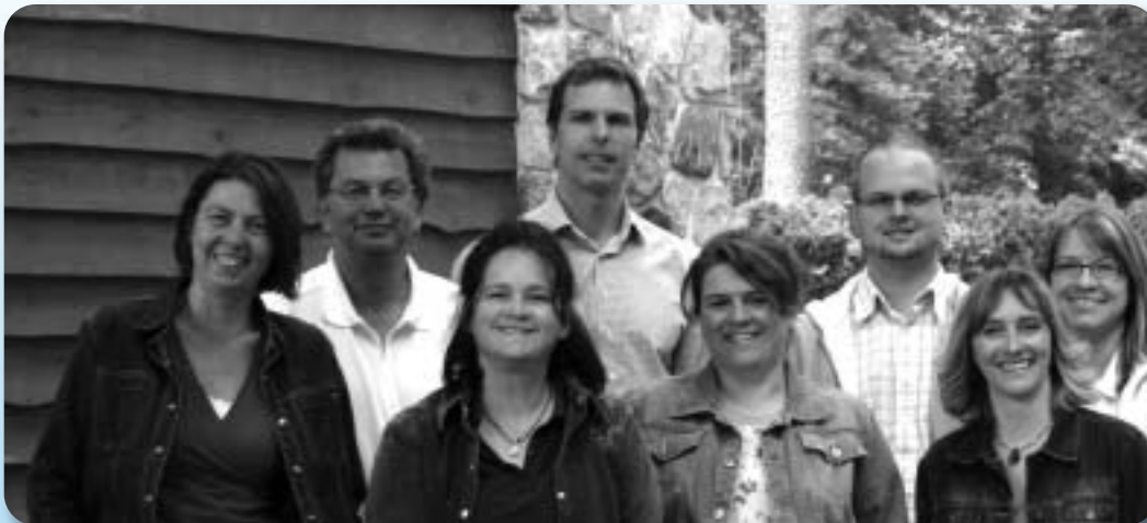
« Formation sur mesure en Environnement pour les municipalités », de l'Université de Sherbrooke

« Ayant suivi des formations d'appoint dans la majorité des universités du Québec, les cours m'ont donné le goût, même à une étape de fin de carrière, de continuer à me spécialiser dans des disciplines qui me permettront d'améliorer la qualité de vie de nos concitoyens. »