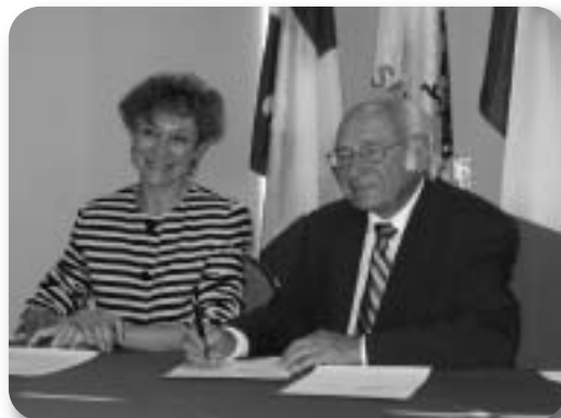
Signature du protocole d'entente avec le Conservatoire national des arts et métiers de Paris