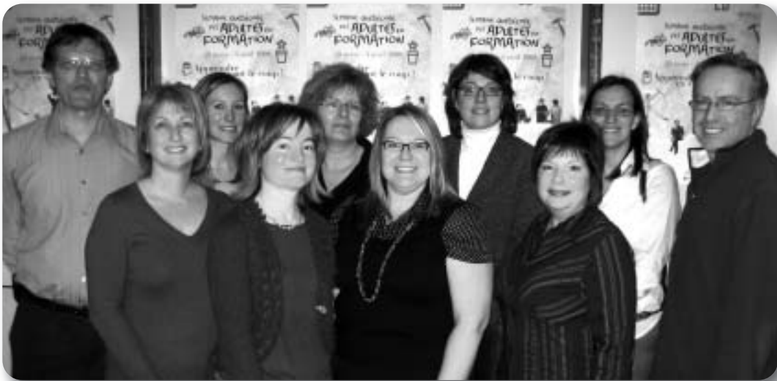
Comité local de la Semaine québécoise des adultes en formation