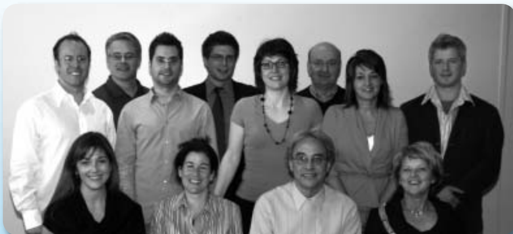
« Certification en Ventes-Marketing », de l'Université Laval