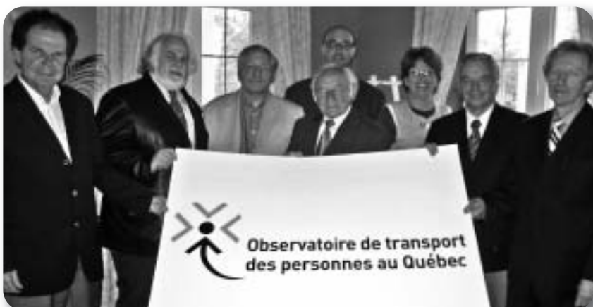
Conseil d'administration de l'Observatoire de transport des personnes au Québec